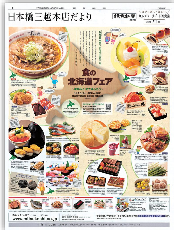
三越伊勢丹 2015.4.30 (ブランケット2P)